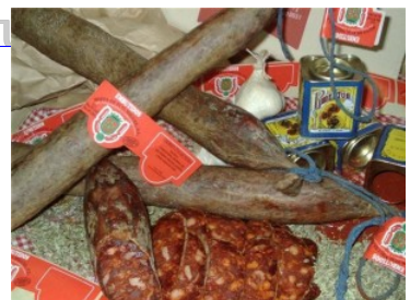
Chorizo Extra Cular 01 chorizo cular 001